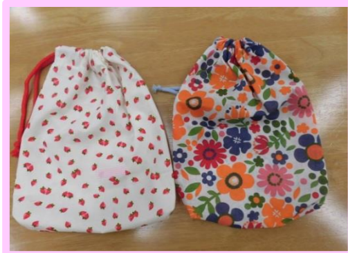
★針を使って手縫いで作った巾着袋