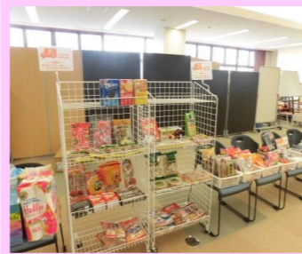
★出張デパート(一宮の里4階)