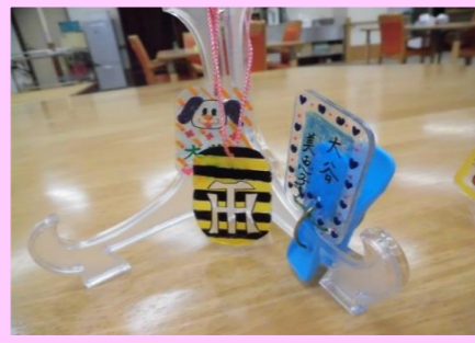
★プラ板を使っの靴ネーム(キーホルダー)