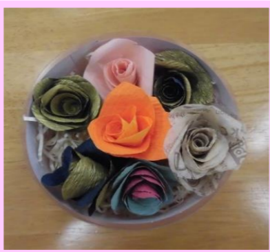
★爪楊枝で色紙を丸めて作るフラワーボックス