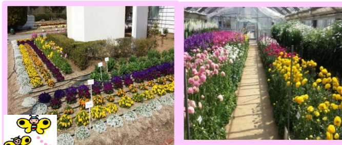
★総合園芸センター(香南町)