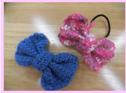
★かぎ針と毛糸で作ったリボン飾り